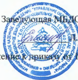
График проведения новогодних утренников МБДОУ «Ёлочка» п. Мотыгино.